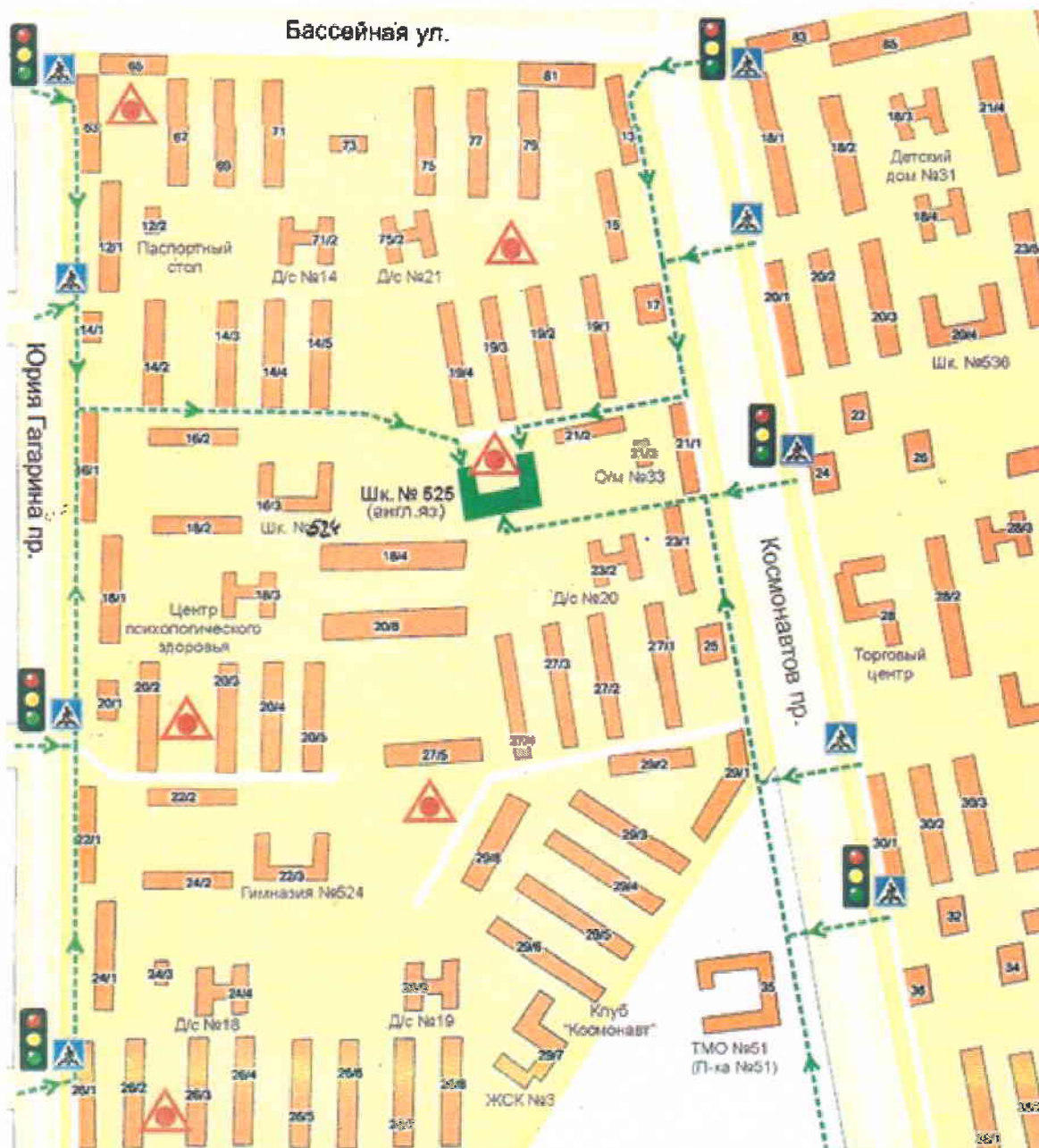
Схема организации дорожного движения в непосредственной близости от образовательного учреждения с размещением соответствующих технических средств, маршруты движения детей и расположение парковочных мест 1 корпус