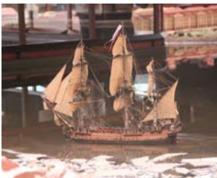
Корабль в Петровской акватории.

27 марта наши корреспонденты вместе с коллегами из других школьных редакций изучали историю в интерактивном музее «Петровская акватория». В театре-макете удалось увидеть то, о чем мы только читали в учебниках.