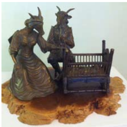
Коза олицетворяет женственность и плодородие, а козел – похоть и взбалмошность.

Козы и люди с древних времен жили вместе. Фольклор, традиции и обычаи многих народов показывают козлиное племя как с положительной, так и с отрицательной стороны, отражая философский смысл жизни. Уникальность козлиного братства можно прочувствовать на выставке «Рога и копыта» в Фермерском дворце Петергофа.