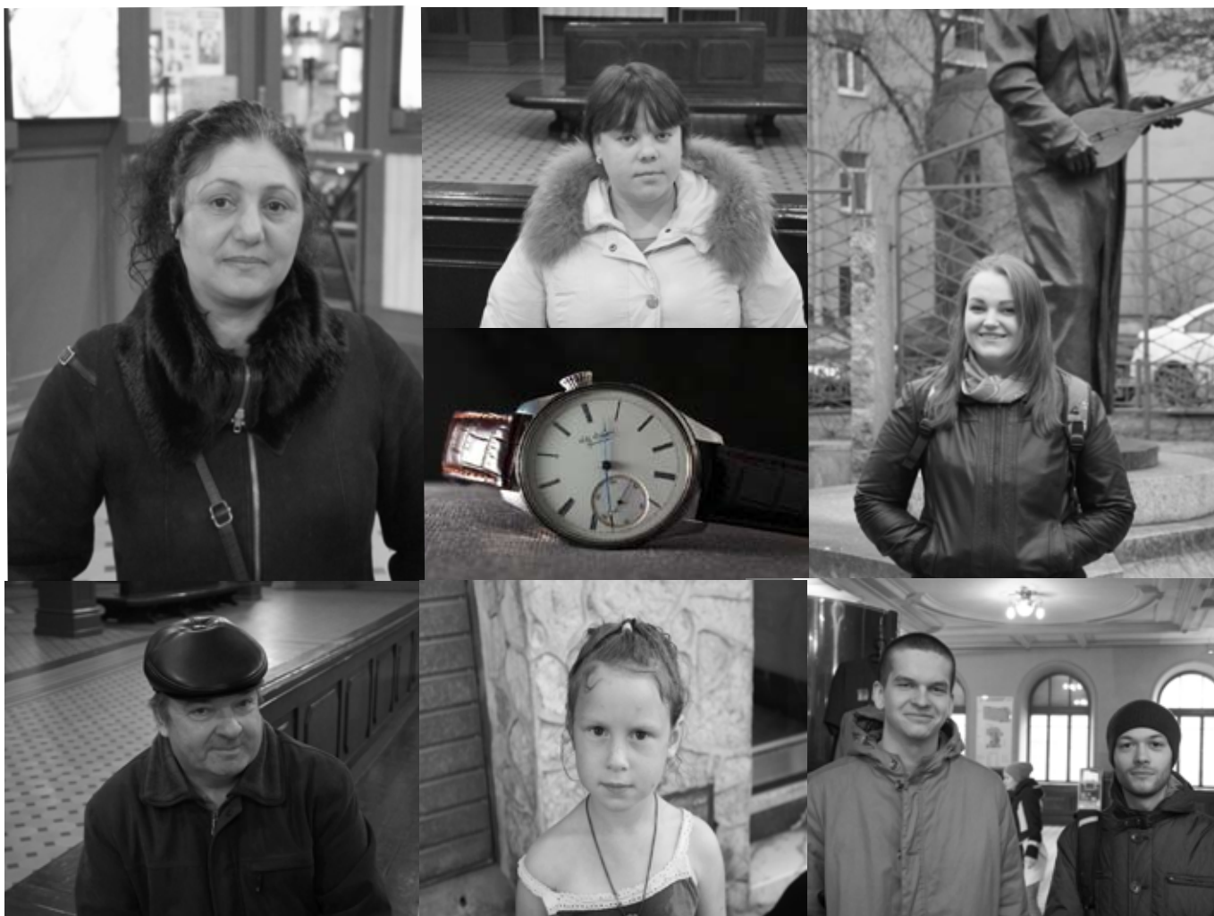
Коллаж Ксении УСПЕНСКОЙ

В мире существует огромное количество коллекций. Все они разнообразны, индивидуальны и полны воспоминаний. Узнать о том, какие коллекции хранятся у наших горожан, и чем они им дороги, на улицы города отправились наши корреспонденты. Есть ли у вас в семье фамильные реликвии, и какие? Имеете ли вы вещи, которые вызывают у вас приятные воспоминания, и чем они дороги? Эти вопросы мы задавали людям, ожидающим поезда на Витебском вокзале. Некоторые люди отвечали быстро, не задумываясь, и даже описывали свою любимую вещь только с помощью прилагательных и существительных.