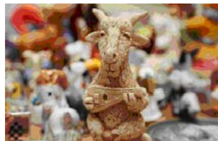
Козлики представляют все жанры искусства.

неотъемлемой частью сказок, мифов и легенд. На протяжении многих веков она балансирует между плюсом и минусом, четко разделяясь по половому признаку. Были и исключения: известный персонаж «козел отпущения» жертвовал собой ради искупления чужих грехов. Люди привыкли в обычной жизни относиться к домашним животным как источнику продуктов и шерсти. Козлики изготовлены из керамики, дерева, ткани, всех видов камня и других самых разнообразных материалов. Один из интереснейших экспонатов – группа металлических фигурок, сделанная