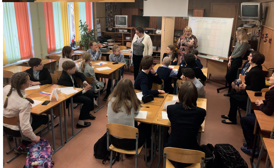
25 апреля в школе № 525 состоялся конкурс-игра по предмету «музыка» для учащихся школ Московского района.

еще и назвать автора, и само произведение. В этот раз ребят ждало новшество. Среди выбираемых ими категорий, был вопрос, связанный с узнаванием флага, столицы той или иной страны и выбором музыкантов – представителей этой страны.