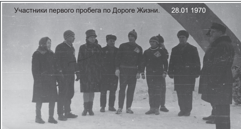
Участники первого пробега по Дороге Жизни. 28.01 1970