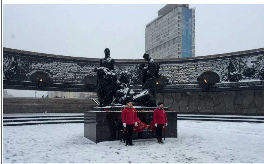
Почетный караул у монумента героическим защитникам Ленинграда. 18.01.18