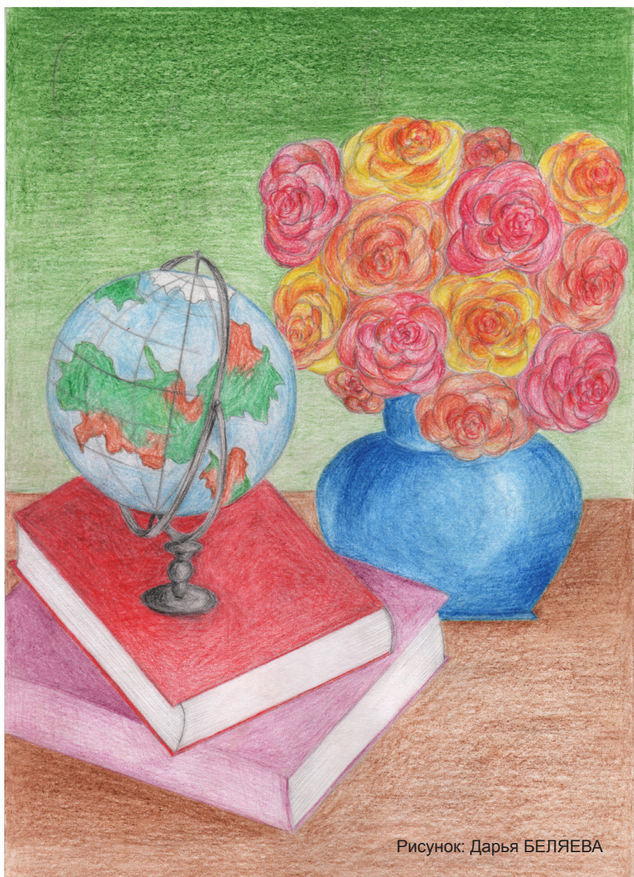
Рисунок: Дарья БЕЛЯЕВА