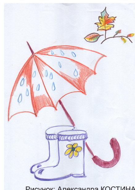
Рисунок: Александра КОСТИНА

Адрес редакции: 196211, СПб, пр. Космонавтов, д. 21, корп. 4, шк. № 525 e-mail: svtany@mail.ru