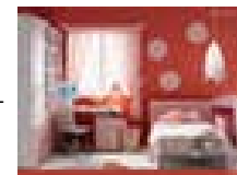
+ room = ...

Now your turn. How many such words can you find? Bring your results to classrooms 304 or 305. The winners will be published in the next issue.