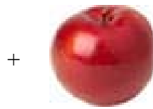
+ apple = ...