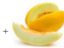
+ melon = watermelon