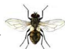
+ fly = butterfly