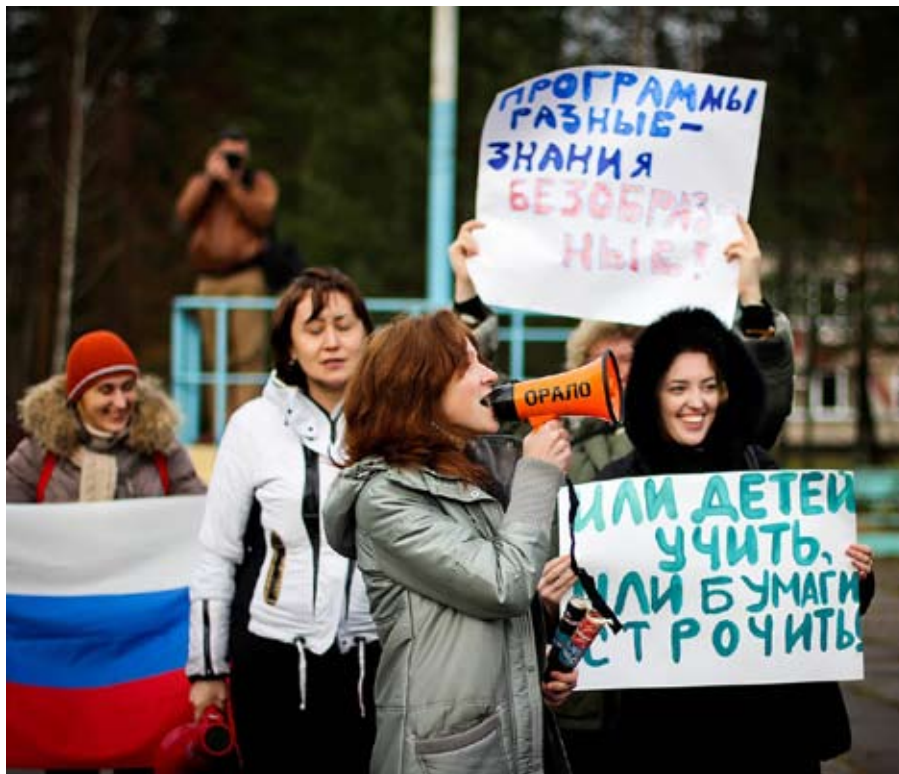
У нас, школьников, тоже есть голос! Мы не хотим больше молчать!