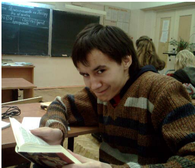
Опрос провела Дарья ГАЙДАР

Из цифр, приведенных выше, следует, что школьники читают книги все меньше, и современные шестиклассники просто перестают интересоваться литературой, что само по себе ужасно.