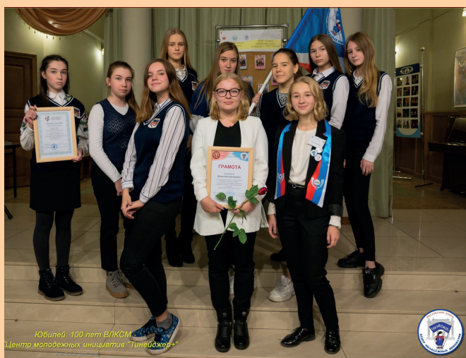
Юбилей 100 лет ВЛКСМ Центр молодёжных инициатив «Тинейджер+»

В конце октября в культурно-досуговом центре «Московский» прошёл фестиваль «Наследники», посвящённый двадцатилетию центра молодёжных инициатив «Тинейджер+». Команда нашего актива теперь входит в ЦМИ «Тинейджер+» и является обладателем собственного флага с символикой организации.