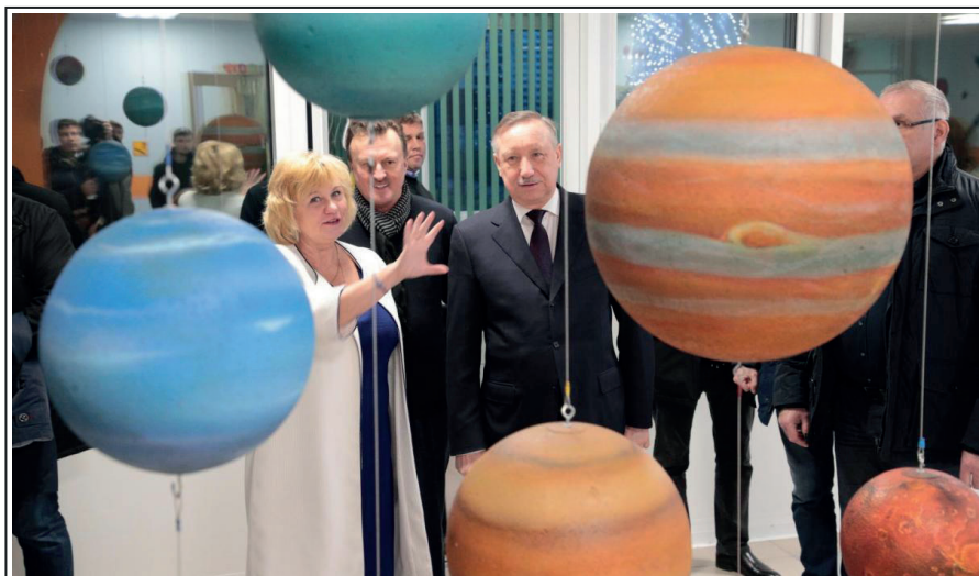
Губернатор Санкт-Петербурга Александр Дмитриевич Беглов оценил «космическое» оформление школы № 525. 21 декабря