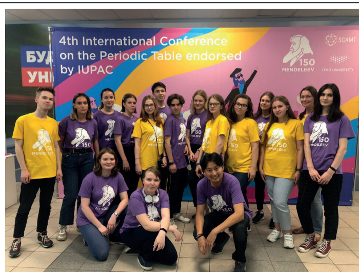
IV Международная Конференция по Периодической Системе Менделеева под эгидой IUPAC, 26-28 июля