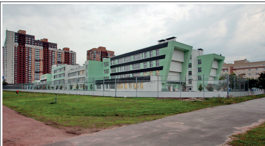
Второе здание школы на пр. Космонавтов, 59.