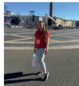
Алые Паруса-2019, 23 июня