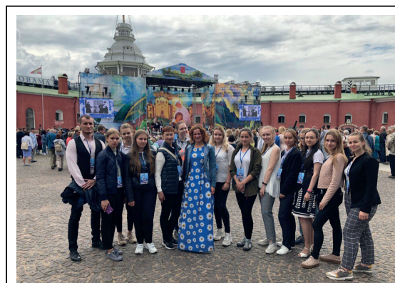
Концерт, посвященный Дню Любви, Семьи и верности, 8 июля