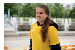
Большой Велопарад ко Дню Города, 27 мая