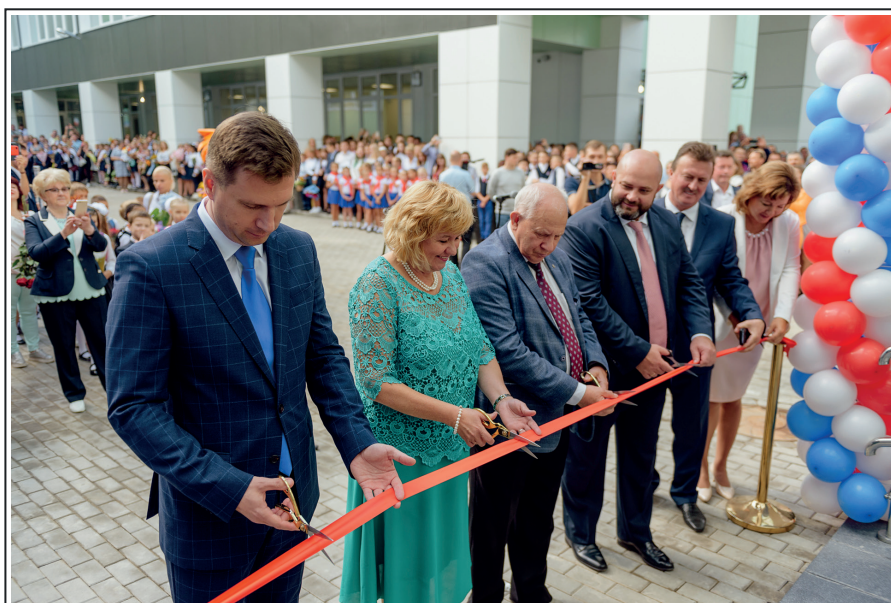
Открытие нового здания школы на проспекте Космонавтов, 59. 2 сентября