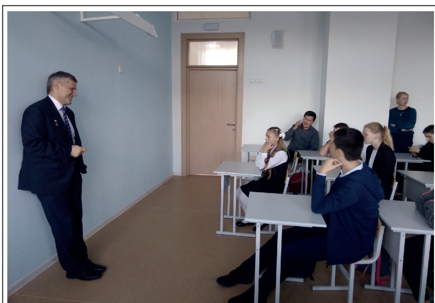
Лётчик-космонавт Андрей Иванович Борисенко беседует с учащимися. 18.09