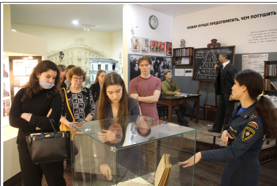
Команды школ № 525 и № 507 на экскурсии в музее Санкт-Петербургского университета Государственной противопожарной службы МЧС России.

Здесь готовят высококвалифицированных специалистов как для Государственной противопожарной службы, так и в целом для МЧС России.