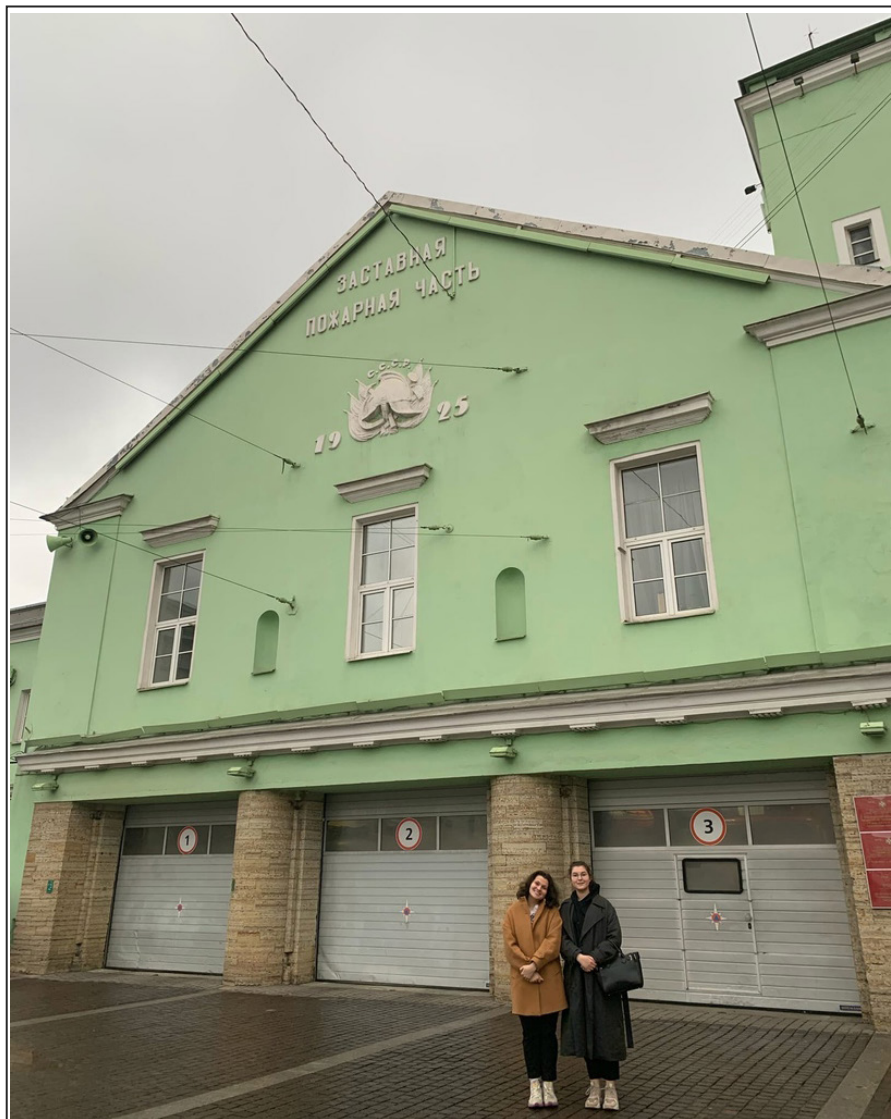
На площади у Московских триумфальных ворот, где раньше находилась застава на границе города, стоит небольшое здание пожарной части – первая постройка Давида Бурыйшкіна.