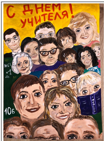
Рисунок Анастасии КАЧАЛОВОЙ